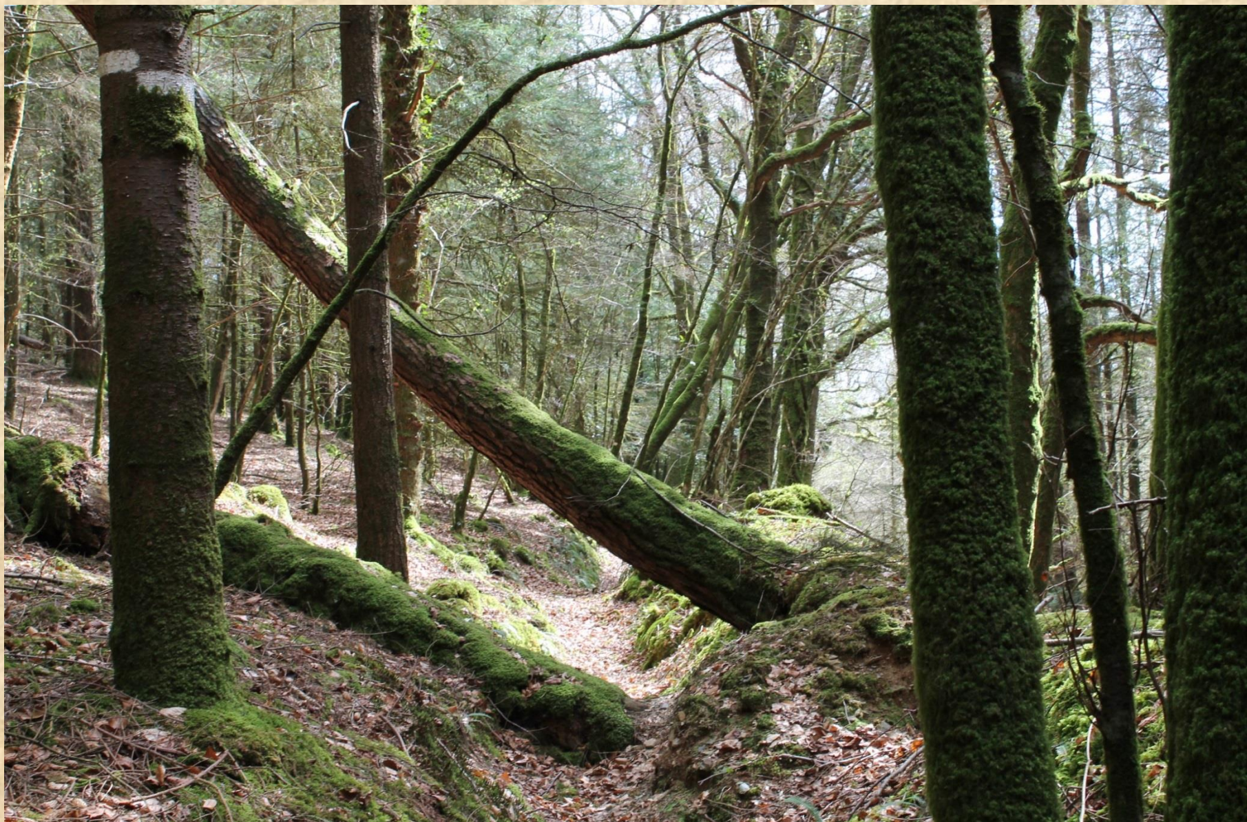
Sentier perdu dans la forêt de Beurc'hoat – avril 2017