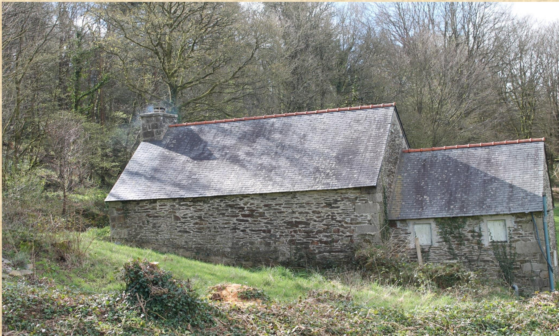
Maison forestière de Beurc'hoat – Facade Nord- avril 2017 Maison de garde forestier du milieu du XIXème siècle. Cette maison était un refuge de maquisards en 1944