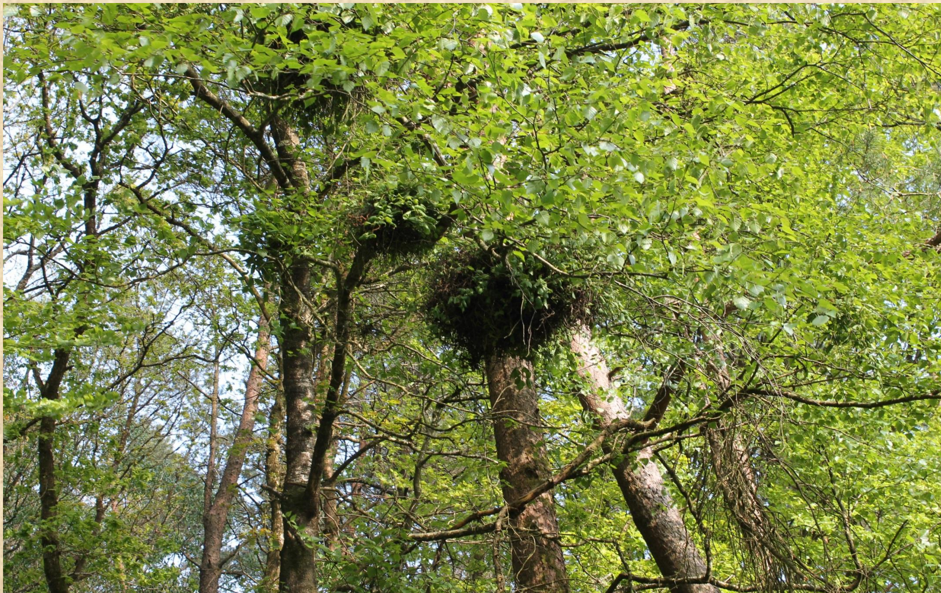
Frondaison –mai 2017- forêt de Beurc'hoat