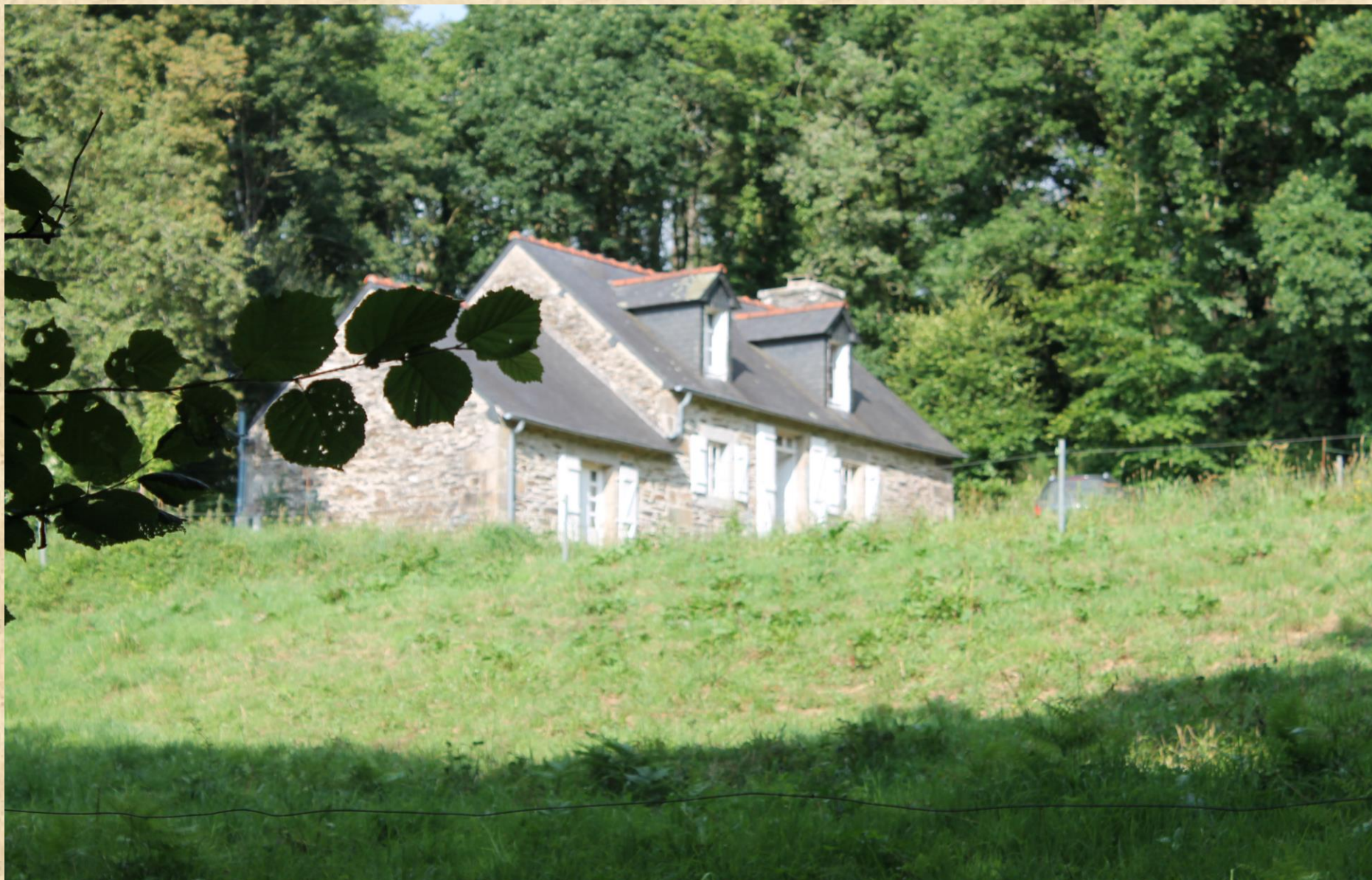
Facade sud maison forestière de Beurc'hoat août 2016