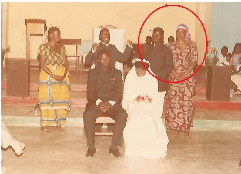
Figure 5 Mon père et ma mère au mariage de ma jeune sœur