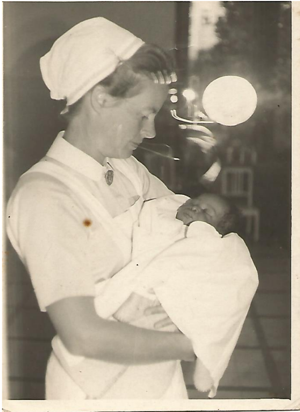
Figure 1. Ma naissance à Neuchâtel