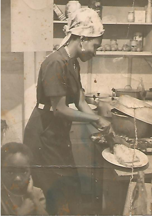
Figure 4. Moi à 4 ans et ma mère (quand mes parents m'avaient repris à 2 ans d'âge et que j'étais tous les jours triste)